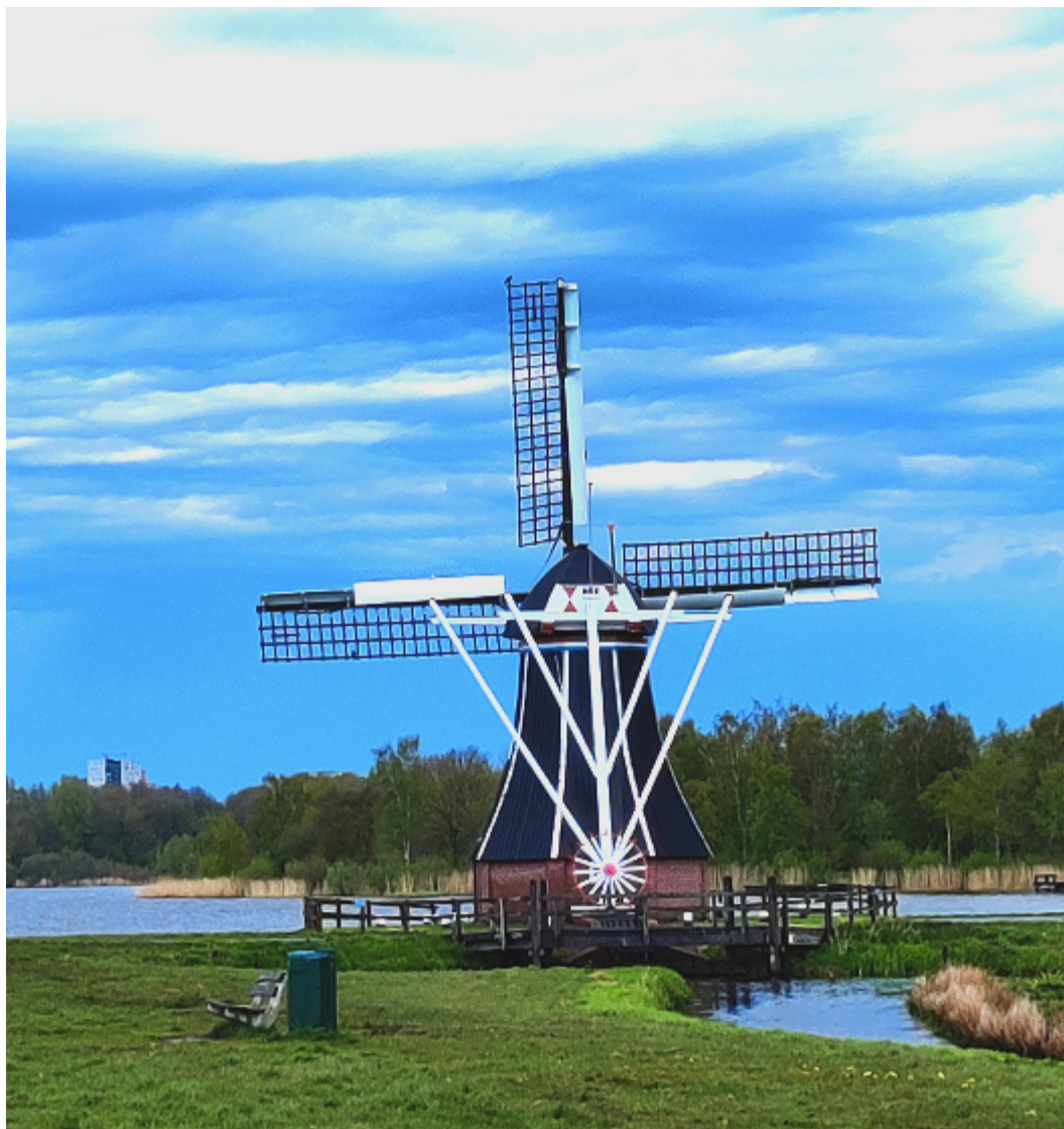
Molen De Helper aan het Paterswoldsemeer

Wie rechtsaf slaat komt al snel in een heel mooi gebied, fietsend langs de oevers van het Paterswoldsemeer. We komen langs een mooi sluisje waar het in de zomer vaak druk is met kleine pleziervaartuigen en we fietsen over het molenpad langs molen De Helper.