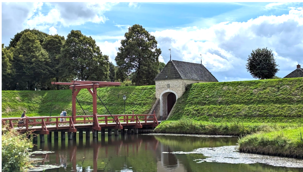
Vesting Bourtange in zicht...

Na het bezoek aan vesting Bourtange gaat het dicht langs de grens met Duitsland weer richting de Ruiten Aa. Langs goudgele korenvelden en groene houtwallen komen we na een aantal kilometers door mooi Westerwolde weer in het dal van de Ruiten Aa .