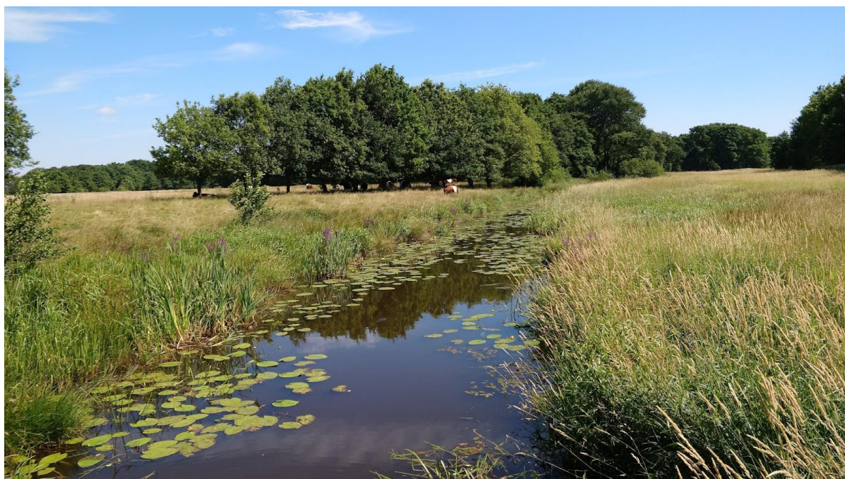
RuitenA in de omgeving van Smeerling...

Na het bezoek aan vesting Bourtange gaat het dicht langs de grens met Duitsland weer richting de Ruiten Aa. Langs goudgele korenvelden en groene houtwallen komen we na een aantal kilometers door mooi Westerwolde weer in het dal van de Ruiten Aa .