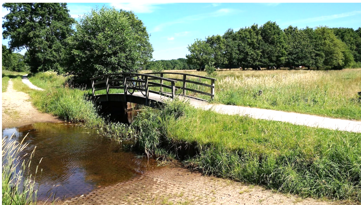
Landschap met bruggetjes en beekjes...

In de tuin van ' Gasterij Natuurlijk Smeerling ', die direct aan de route ligt, kun je terecht voor koffie, een drankje en streekgerechten. Een sfeervol terras midden in de natuur.