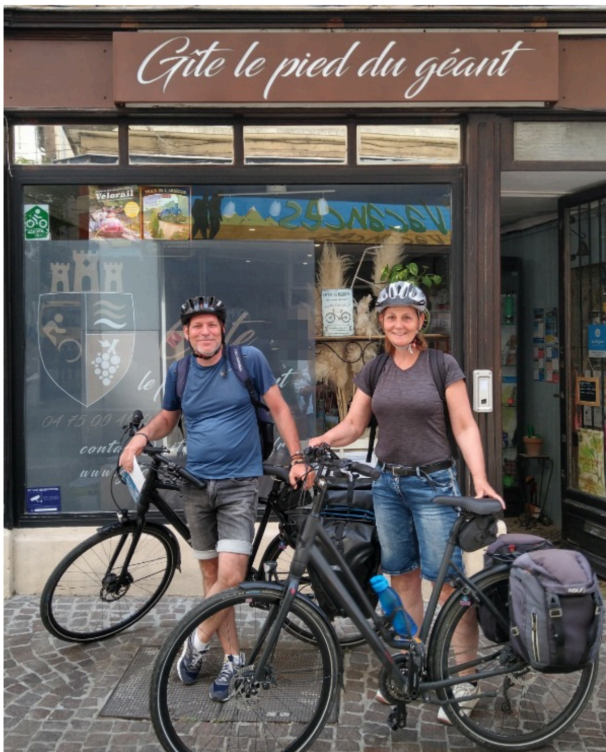
Partner in de Ardeche