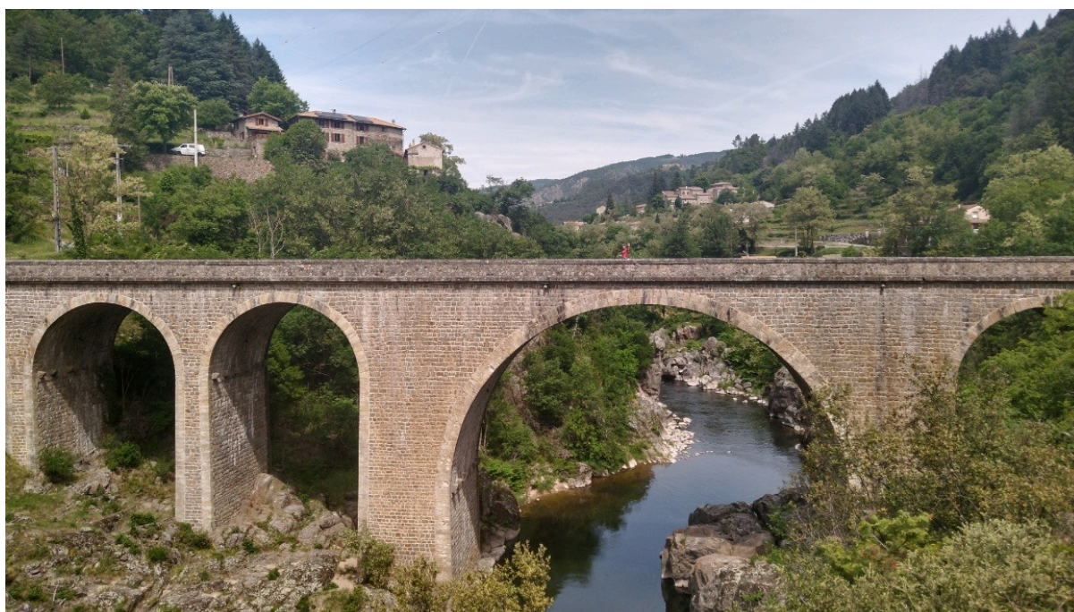
Regelmatig is te zien dat het traject over een oude spoorlijn voert. Oude spoorbruggen en korte tunneltjes overbruggen de dalen en de rivier...