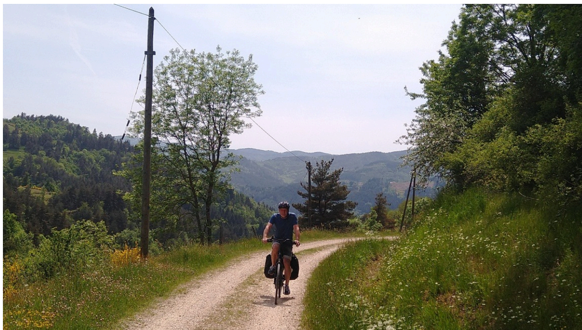
Onderweg in de Ardeche...